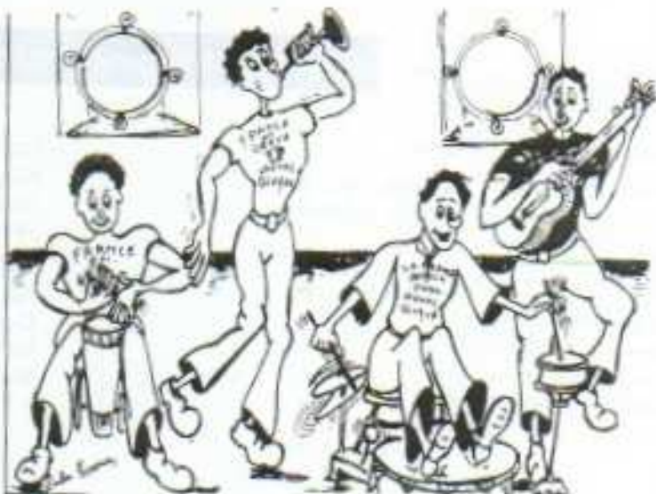
POUR GARDER LE SOURIRE

Le Syndicat C. G. T. du personnel de la Caisse d'Allocations Familiales de Paris salue chaleureusement l'équipage du Paquebot "France" qui a engagé la lutte en occupant le navire. Il assure les marins et leurs syndicats de sa solidarité.