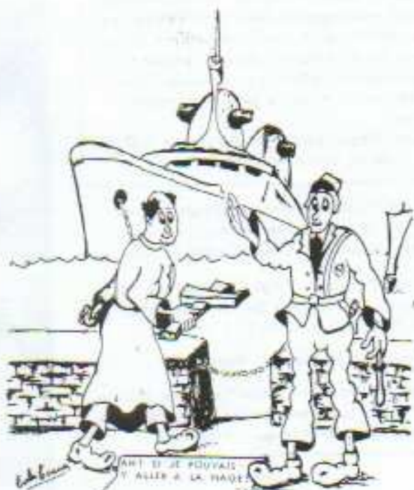
ANT ET JE POUVAIS Y ALLER A LA HAÏE

Assez satisfaisante au cours de la semaine. Pas de troubles sérieux à craindre. Votre résistance sera supérieure à la moyenne.